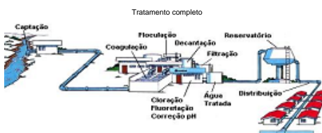
Ilustração dos modelos de sistemas de abastecimento

Ao receber água transportada por caminhão-pipa exija a " Autorização para Transporte de Água Potável - Caminhão Pipa" e verifique se os registros de descarga do tanque estão com o lacre padrão Sanepar.