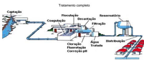
Ilustração dos modelos de sistemas de abastecimento

Ao receber água transportada por caminhão-pipa exija a " Autorização para Transporte de Água Potável - Caminhão Pipa" e verifique se os registros de descarga do tanque estão com o lacre padrão Sanepar.