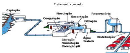
Ilustração dos modelos de sistemas de abastecimento

Ao receber água transportada por caminhão-pipa exija a " Autorização para Transporte de Água Potável - Caminhão Pipa" e verifique se os registros de descarga do tanque estão com o lacre padrão Sanepar.