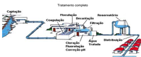
Ilustração dos modelos de sistemas de abastecimento

Ao receber água transportada por caminhão-pipa exija a " Autorização para Transporte de Água Potável - Caminhão Pipa" e verifique se os registros de descarga do tanque estão com o lacre padrão Sanepar.